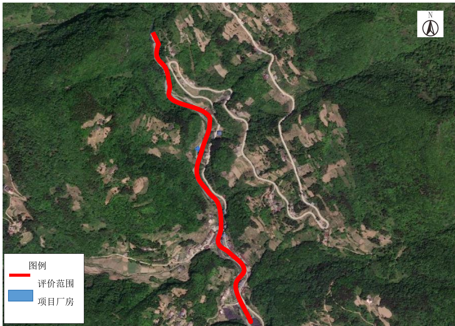
图 1.3-1 地表水环境影响评价范围图